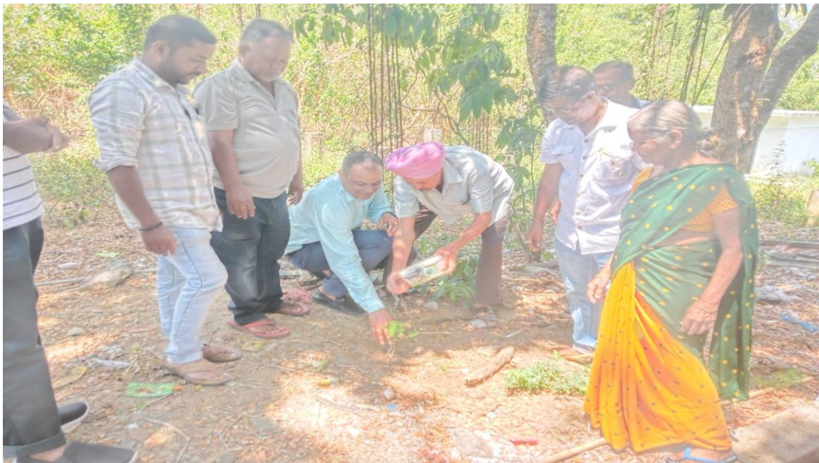
Planted Papaya Trees in the premises of the Kissan Service Cooperative Society Ltd., Tushnabad